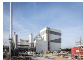
Le construction de Tilbury Green Power.

Chaudière : 125 MW apport de chaleur du combustible 92 bara 477°C Puissance électrique (nette) : 40 MW e