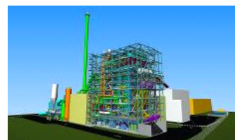
Illustration 3D de la centrale de Tilbury Green Power près de Londres.