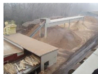
La centrale CHP à la biomasse de FunderMax utilise pour combustible des déchets de bois provenant de la production des agglomérés et contreplaqués.