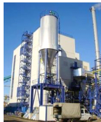
Fundermax Biomasse Energieanlage est une centrale de cogénération à la biomasse chaleur-électricité (CHP) située à Neudörfel, en Autriche.