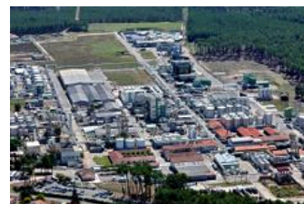
Vue aérienne de l'emplacement de DRT à Vielle-Saint-Girons dans les Landes.