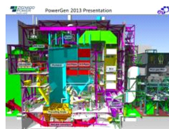
Illustration 3D de la centrale électrique Zignago (Cliquez pour agrandir, contactez le service commercial pour recevoir l'entière présentation)