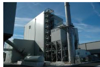
Centrale électrique Western Wood, Pays de Galles - Royaume Uni

Chaudière: 48 MW apport de chaleur du combustible 92 bar 512°C Électrique: 16 MW e