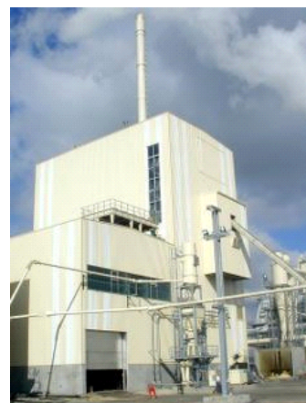
La centrale de cogénération Swiss Krono produit de l'électricité (20MWe) et du chauffage (10 MW).