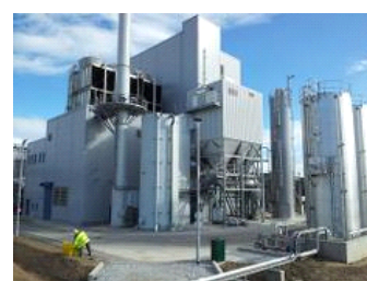
Roth's CoRDe CHP Plant, l'Écosse.

Cliquez ici pour voir les références d'AET pour les Systèmes à la technologie DeNOx RNCS