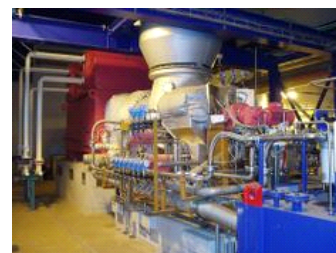
AET fournit des services après vente - présenté dans la photo: FunderMax Allemagne