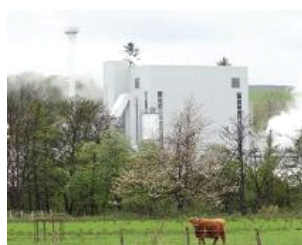
La centrale Rothes CoRDe Ltd est une centrale de cogénération à la biomasse,