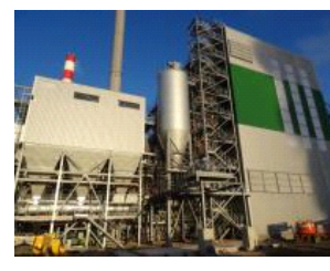
Le projet Biolacq Energies, à Lacq, est une centrale de cogénération à biomasse d'une