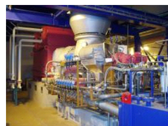
AET fournit des services après vente - présenté dans la photo: FunderMax Allemagne