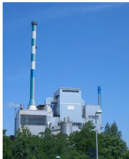
Boehringer Ingelheim Pharma KG, Allemagne, une centrale électrique ayant une capacité de 70 MW, utilise des déchets de bois comme combustible.