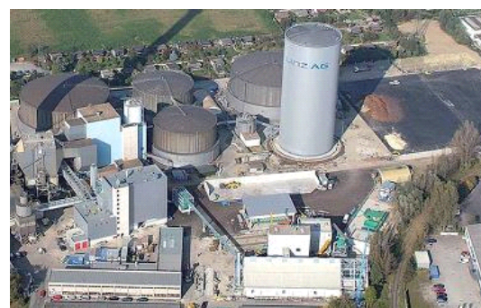
Le 18 % du chauffage urbain global pour la troisième plus grande ville d'Autriche, Linz, est assuré par une centrale de cogénération chaleur-électricité (CHP) à la biomasse.