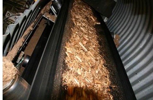
La bande transporteuse qui amène les copeaux de bois à la chaudière